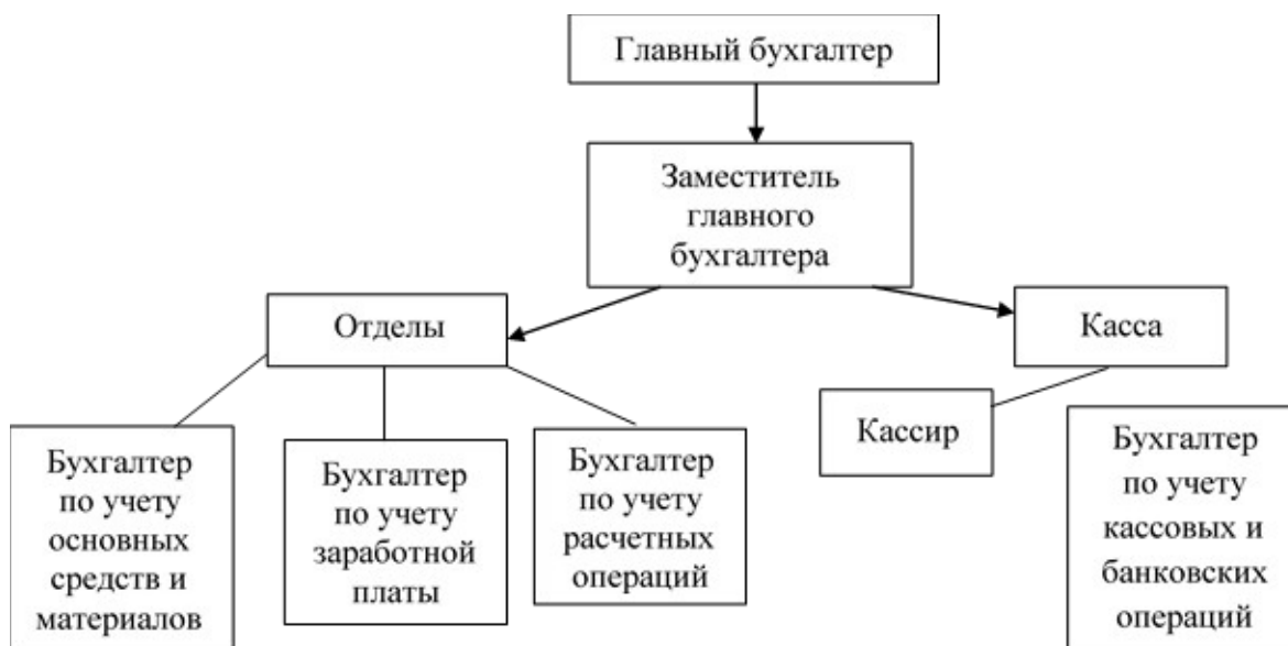
Рис. 2 Структура бухгалтерии предприятия ООО «ПАРАДАЙЗ ДЕЛИВЕРИ»

Структура бухгалтерии предприятия ООО «ПАРАДАЙЗ ДЕЛИВЕРИ» представлена на рис. 2.