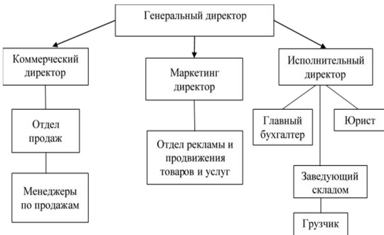
Рис. 1 Организационная структура предприятия ООО «ПАРАДАЙЗ ДЕЛИВЕРИ»